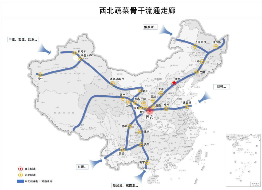
图 2-2 西北蔬菜骨干流通走廊

重点项目总占地面积约 3000 亩，总投资约 108.5 亿元，主要建设内容涵盖粮食、果蔬、农资、肉类和水产品交易展示区，冷链仓配、电子商务交易、加工储备（应急保供）、城乡物流配送、检验检测、名优特农产品展销等配套服务功能区。西安农产品物流城、陕西丝路农贸港两大项目由市农投集团投资建设，将整合西安粮油、欣桥、方欣、雨润等绕城高速内现有大型农产品批发市场资源，分别在西安蓝田、咸阳三原建设大型现代化农产品交易物流中心。