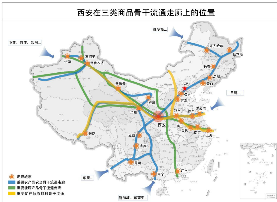
图 2-1 西安在三类商品骨干流通走廊上的位置

北地区蔬菜骨干流通走廊“廊主”城市，与对应产地、集散地、销地开展产销对接和分工协作。